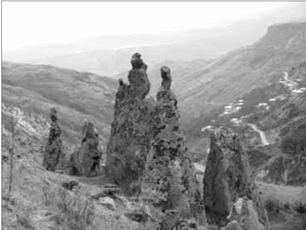
Վարարակնի բարձրադիր ափին

Լոր պարտավորությունները, տված վնասի համար դրամական փոխհատուցում ապահովել, այգիների, բանջարանոցների ոռոգման համար ջրատար առուներ կառուցել, դրան էլ գումարած լրացուցիչ աշխատատեղեր ստեղծել՝ յուրաքանչյուր կայանի հաշվով ութ աշխատատեղ: Ամեն ինչ լավ է, գայլերը կուշտ են, ոչխարները՝ ողջ: Միայն չգիտես՝ ինչու այգիների սեփականատերերը չեն բաժանում գյուղապետի լավատեսությունը: