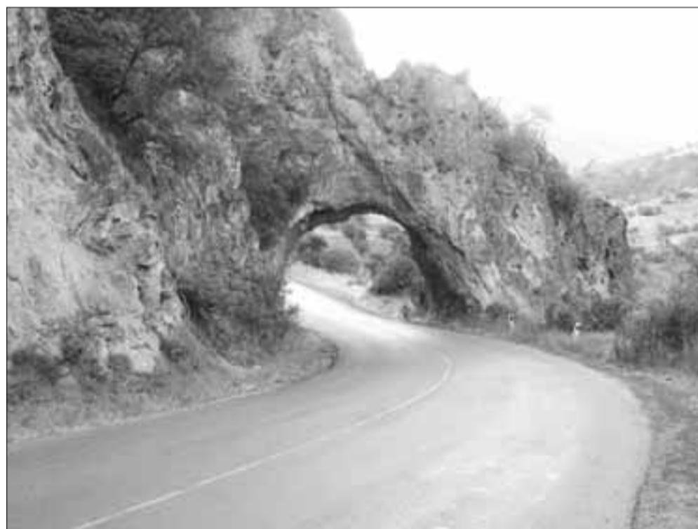
Գորիս - Կապան մայրուղու ծակերը

Գետակը խողովակների մեջ առան, բարձրացրին սարավանջով, որպեսզի ջրի անկման անկյունը մեծ լինի, ու բարձրությունից ջուրը բաց թողեցին, ասելով՝ թող լինի լույս: Ու եղավ լույս, ու եղավ նաեւ փող: Տեսան, որ լավ է, ու